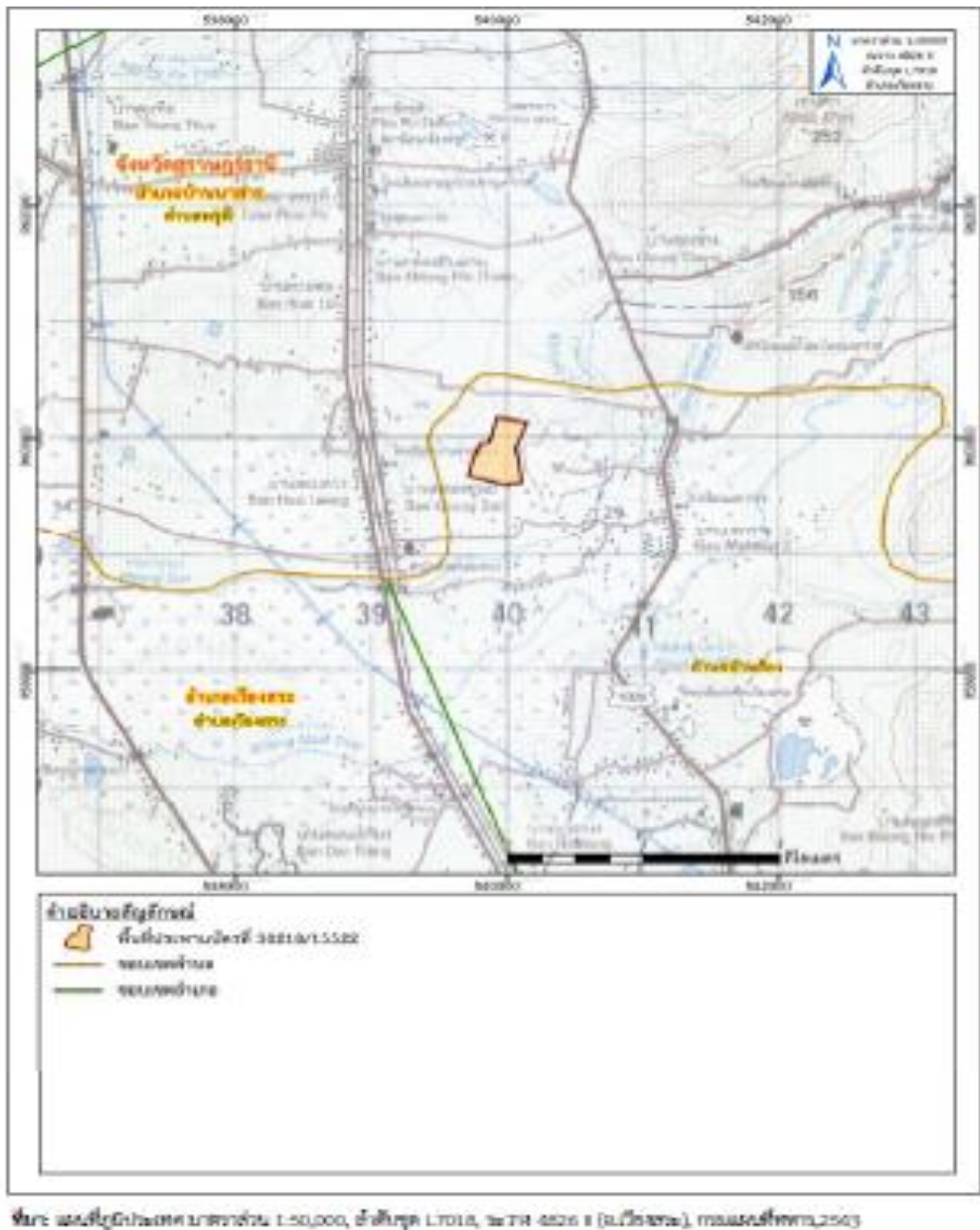
รูปที่ 1-1 แสดงตำแหน่งที่ตั้งพื้นที่โครงการและเส้นทางคมนาคม

สำหรับ แผนการตรวจวัดคุณภาพสิ่งแวดล้อมตามเงื่อนไขแนบท้ายประทานบัตร อยู่ในตารางที่ 1-1 วิธีการเก็บตัวอย่าง วิธีวิเคราะห์คุณภาพสิ่งแวดล้อม มีรายละเอียดดังตารางที่ 1-2 พิกัดสถานีตรวจวัดอยู่ในตารางที่ 1-3